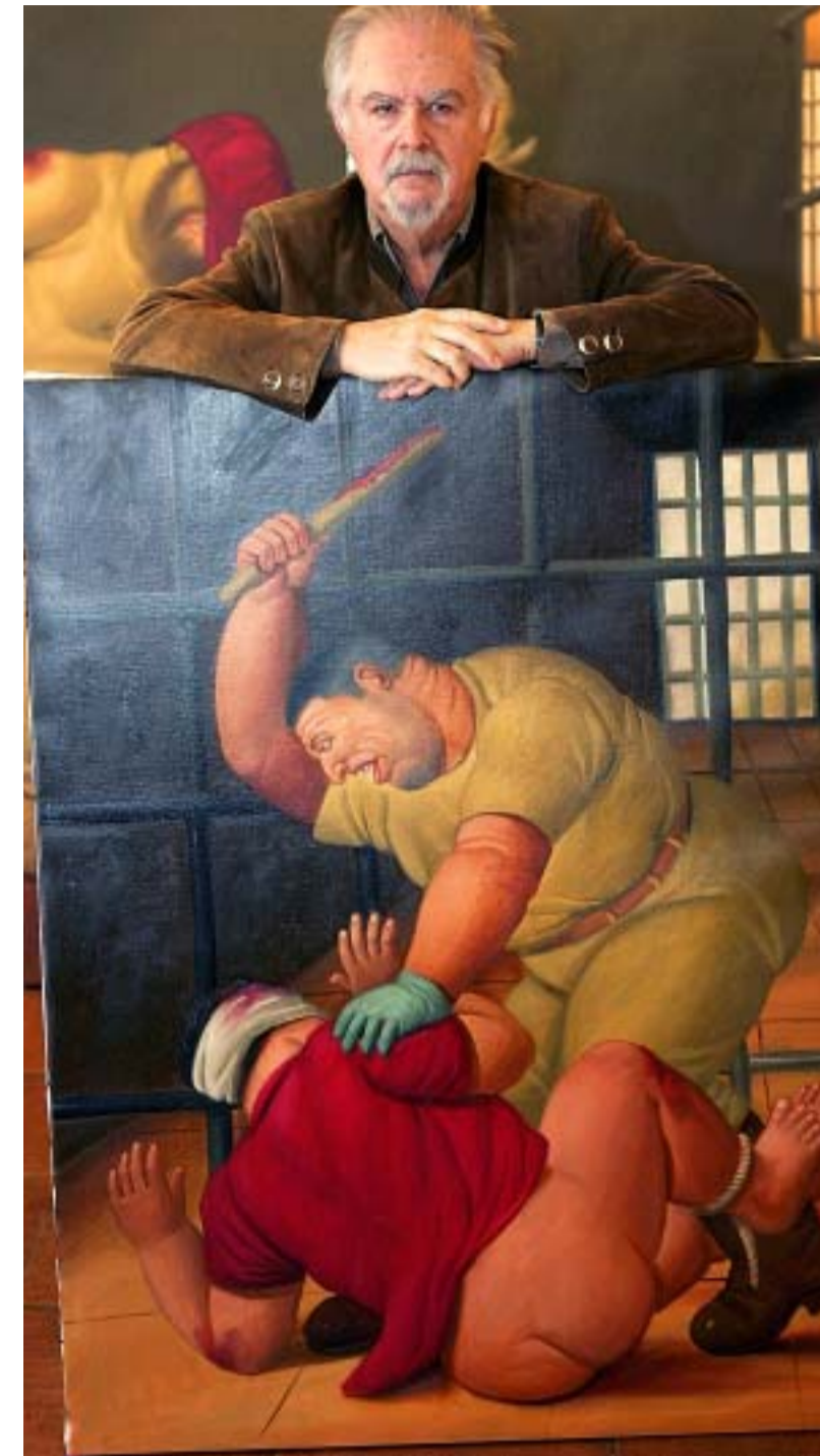
► La colección "Abu Ghraib", de Fernando Botero, surgió ante la indignación que sintió al enterarse de las torturas a las que fueron sometidos soldados de Iraq.

"(Reyes) es un escritor muy leído, muy conocido, pero queremos que se siga leyendo, hicimos vivo a Alfonso Reyes el día de hoy".